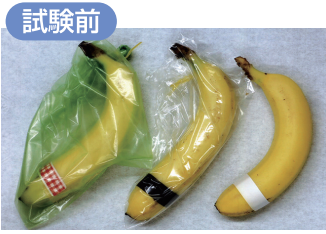
愛菜果 ポリエチレン袋 無包装