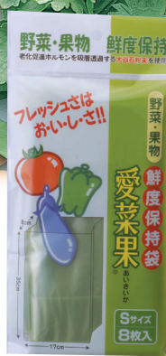
Sサイズ 約24×12cm 8枚入

愛菜果は大谷石を粉砕して練り込んだポリエチレンフィルムです。大谷石は多孔質の石で、その穴が野菜の生長を促進させるエチレングスを吸着透過します。また適度な気体透過性をもち、袋の中に水分が付きにくい加工を施すことで腐敗の原因となる雑菌類が繁殖しにくくなっています。