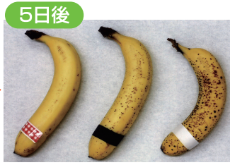
愛菜果 ポリエチレン袋 無包装