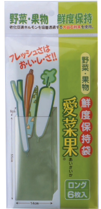
ロングサイズ 約26×12cm 6枚入