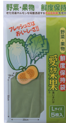
Lサイズ 約26×14.5cm 5枚入