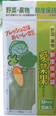
Mサイズ 約25×12.5cm 6枚入